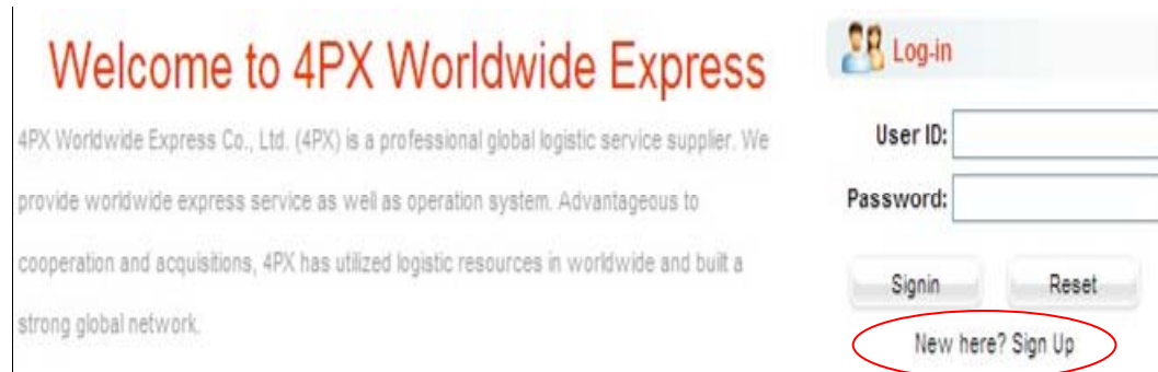
(圖 1) 登錄或註冊頁面